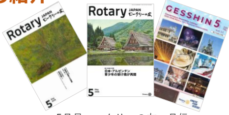
5月号ロータリーの友・月信