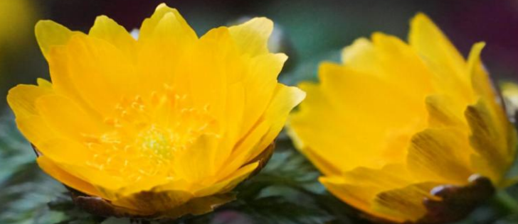
“幸福”と“長寿”の花「福寿草」