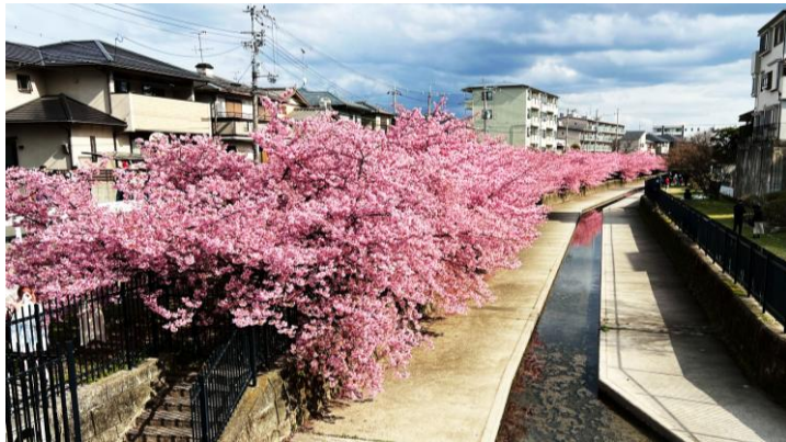
3月上旬 「河津桜」 京都市淀新町