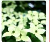
6月上旬 ヤマボウイン 木曾町