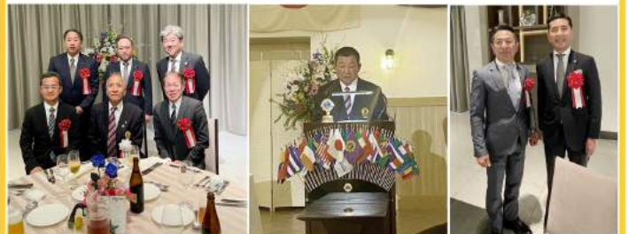
古井LC会長 来賓 小栗市長