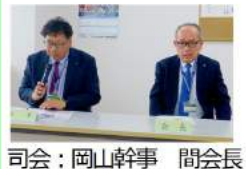
司会：岡山幹事 間会長