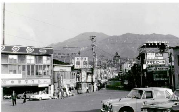
昭和40年頃 中津川 駅前