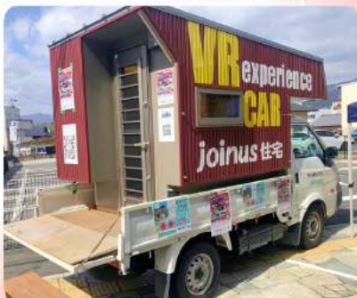
岡山工務店 走るモデルハウス