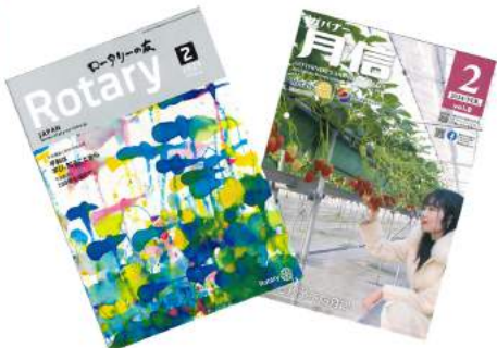
2月ロータリーの友・月信