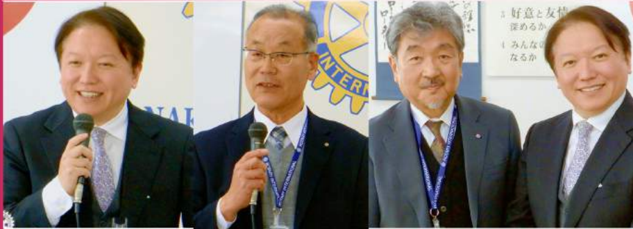
木原創学園長 木下親睦委員長 安藤会長 木原創学園長