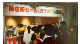
六斎市等の行事と共催したイベントの風景

中津川市ひと・まちテラスは子育て支援、市民交流、学び(図書館)、観光の4つの機能をひとつに集めた複合施設としてオープンしました。オープンして約1ヶ月半、延べ約8万人の市民が利用しています。ローター会員企業にも商談や会議等で、幅広く活用頂けるとありがたいです。