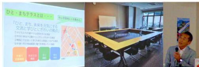
中津川市ひと・まちテラスの施設概要をパワーポイントにてご紹介