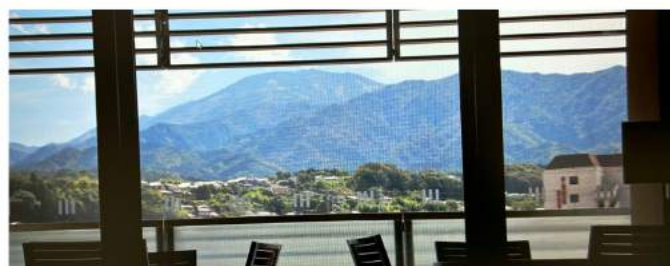
テラス席から恵那山が一望できます

中津川市ひと・まちテラスは子育て支援、市民交流、学び(図書館)、観光の4つの機能をひとつに集めた複合施設としてオープンしました。オープンして約1ヶ月半、延べ約8万人の市民が利用しています。ローター会員企業にも商談や会議等で、幅広く活用頂けるとありがたいです。