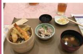
食事は着席者から順次配膳