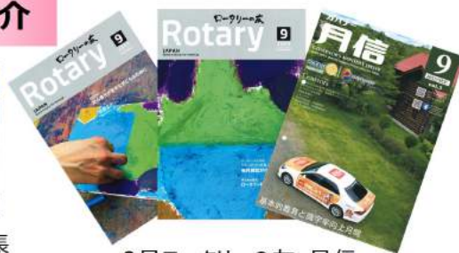
9月ローターの友・月信