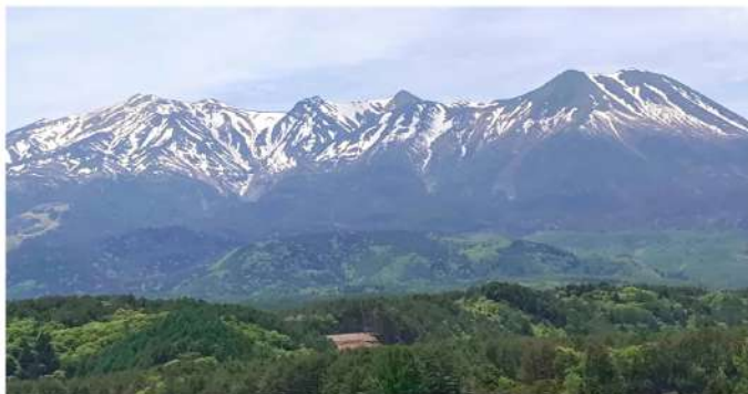
5月下旬 新緑に映える残雪の御嶽山