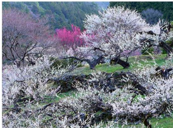
3月中旬 梅の花

ロータリー歴 2009年 1月 多治見ロータリークラブ入会 2013年～2014年度 クラブ幹事 2015年～2016年度 クラブ会長 マルチプル・ポールハリス・フェロー 米山功労者