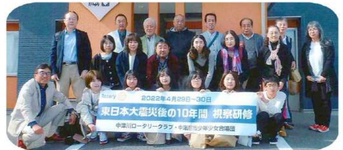
「東北震災後の10年間 視察研修」 2022年4月29日・30日

先日新聞に被災地での追悼式典が減り続けているとの記事がありました。被災42市町村のうち震災後10年の2021年に31の市町村で行われた追悼式典が今年は19自治体に減るそうです。震災の経験を伝える、振り返る機会が減っています。いつ何時私たちも被災するか分かりません。多くの方に寄り添うことを忘れないようにするとともに、日ごろの準備を怠らないようにしたいと思います。