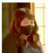
中津川 JC 段 次期理事長