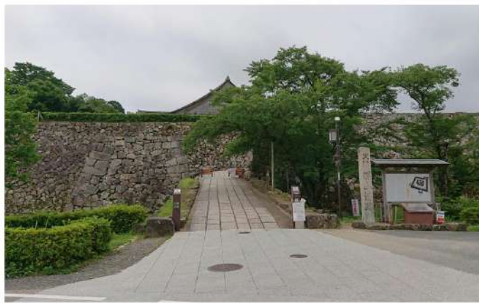
篠山城跡 (ささやまじょう) 兵庫県

徳川家康の命により1609年築城。二の丸御殿の大書院が2000年に復元されている。写真は書院正面の石積み。大書院は木造住宅建築としては現存する同様の建物の中では、京都二条城の二の丸御殿遠侍に匹敵する建物です。 2020.7.23 撮影