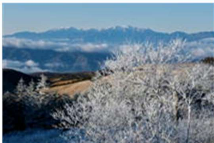
12月上旬 霧ヶ峰高原