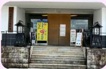
中山道歴史資料館