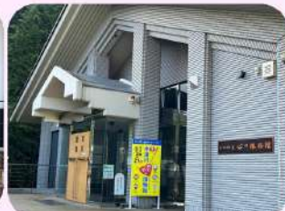
東山魁夷心の旅路館