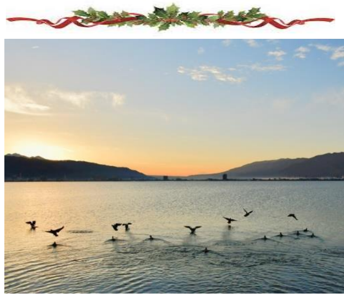
12月17日 下諏訪町諏訪湖畔にて