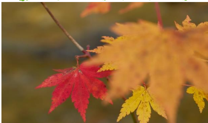
10 月下旬 上松町赤沢自然休養林にて