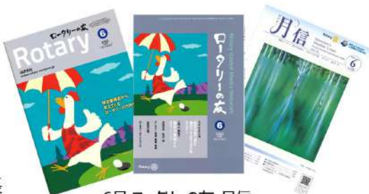
6月ロータリーの友・月刊