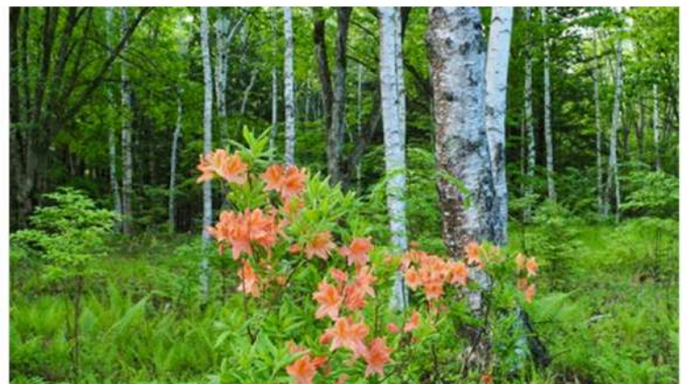
6月中旬 高山市日和田高原にて

1996年1月 中津川RC入会 2002～03年 中津川RC幹事 2008～09年 中津川RC会長 マルチプル・ポール・ハリス・フェロー ベネファクター 第5回米山功労者