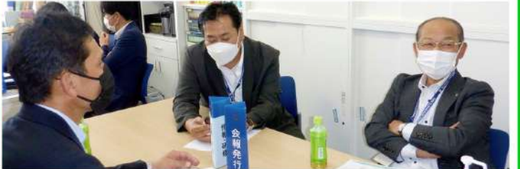
会報発行委員会、情報・研修委員会