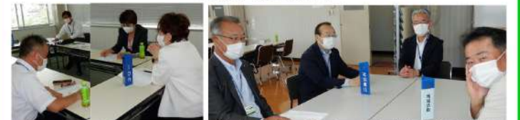
I D M委員会