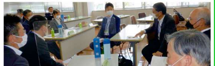
例会運営委員会、睦睦委員会、会員増強委員会