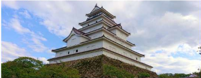
福島県会津若松市 地元では鶴ヶ城と呼ばれている。写真は1965年に鉄筋コンクリートで外観復元された天守です。 2019. 9. 21 撮影