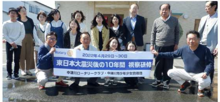
10年前に合唱を行った庄司事務所前