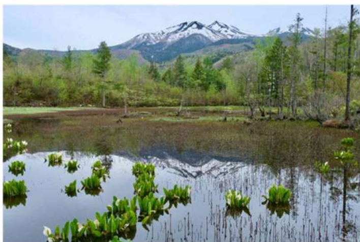
5月中旬 乗鞍高原にて

2014年7月 中津川RC入会 2016年 - 2017年 特命担当G理事 2017年 - 2018年 職業奉仕担当G理事 2020年 - 2021年 国際奉仕担当G理事 2021年 - 2022年 副会長