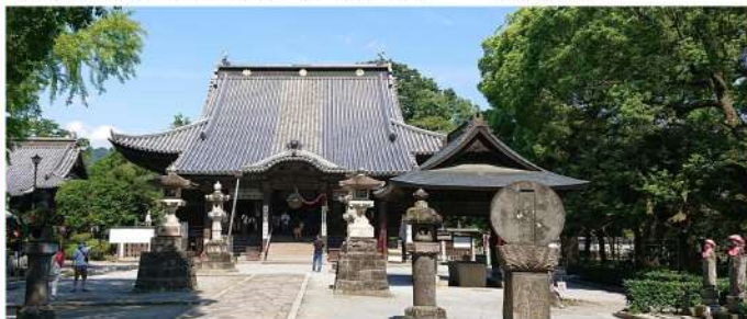
栃木県足利市 現在は、足利家の菩提寺、鏝阿寺(ばんなじ)。ほぼ正方形で土塁が残っています。 2019. 9. 22 撮影