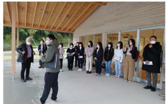
大川小学校の語り部 永沼様より説明

5月26日(木)例会にて 社会奉仕委員会の 『東北震災後の 10年間 視察研修』 報告会があります。