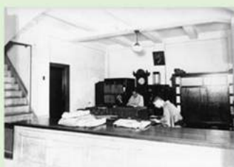
背景に皇室の写真 業務姿は和服です 大正末期 中津町営質屋