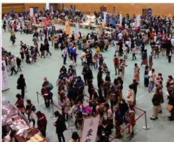
菓子まつり会場内