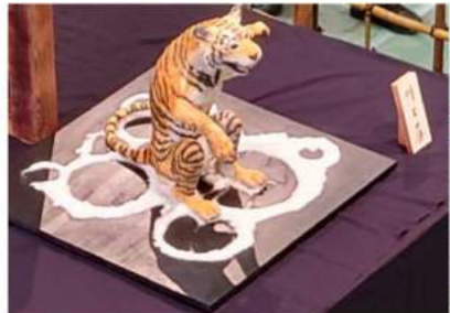
工芸菓子 来年の干支 『寅～招き寅～』