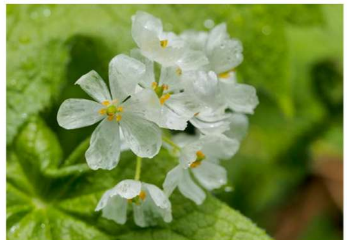
6月下旬桐池自然園にて「サンカヨウ」