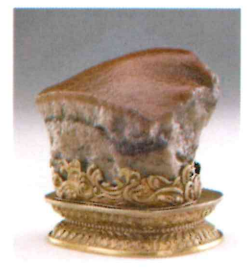
下段右: 肉形石 (にくがたいし) = 豚の角煮