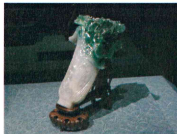
下段左: 翠玉白菜 (すいぎょくはくさい) = 白菜のキリギリス