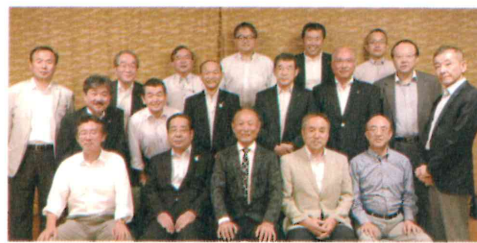
1年間お疲れ様でした！！