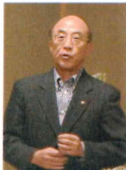
可児会場監督 総評